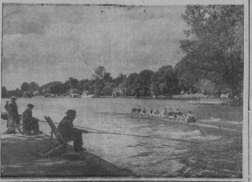
El agua satisface caprichos para todos los gustos: baños, regatas, natación y hasta la pacienzuda pesca a caña. Aquí tienen estos pacientes pescadores y unos alegres remeros que se miran como sin comprenderse mutuamente en lo que toca a los respectivos gustos