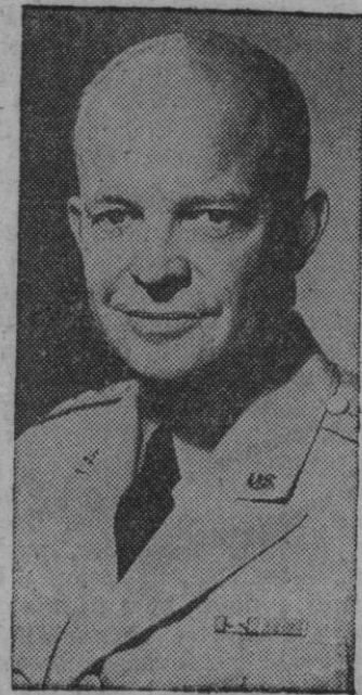
El presidente de los Estados Unidos que, a su vuelta de Ginebra, se ha dirigido a la gran nación americana y ha afirmado la existencia de un "nuevo espíritu" en la consideración de los problemas del mundo y de un ferviente deseo de paz