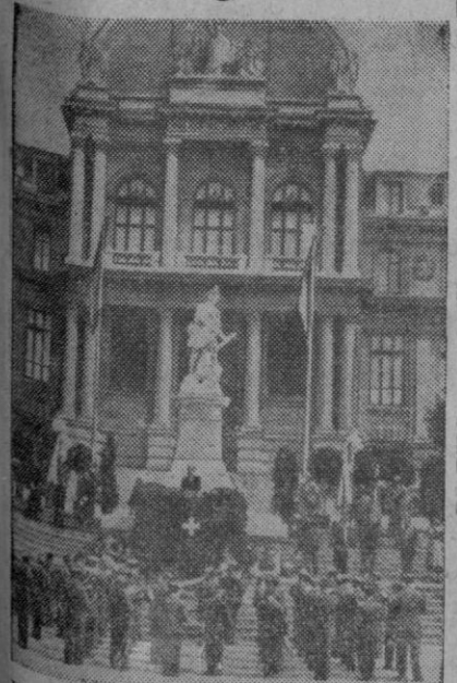
Un bonito palacio de Lausana, ante cuya fachada se levanta un monumento al héroe de la independencia suiza, Guillermo Tell. La fotografía recoge un momento en que se le rinde homenaje.

Washington, 30 (4 t.).—Las tres grandes potencias occidentales han propuesto a Rusia que la próxima Conferencia de los «cuatro grandes» representados por sus jefes de Gobierno, se celebre en Lausana (Suiza), en los últimos días de Julio, según se ha sabido hoy de fuente autorizada.