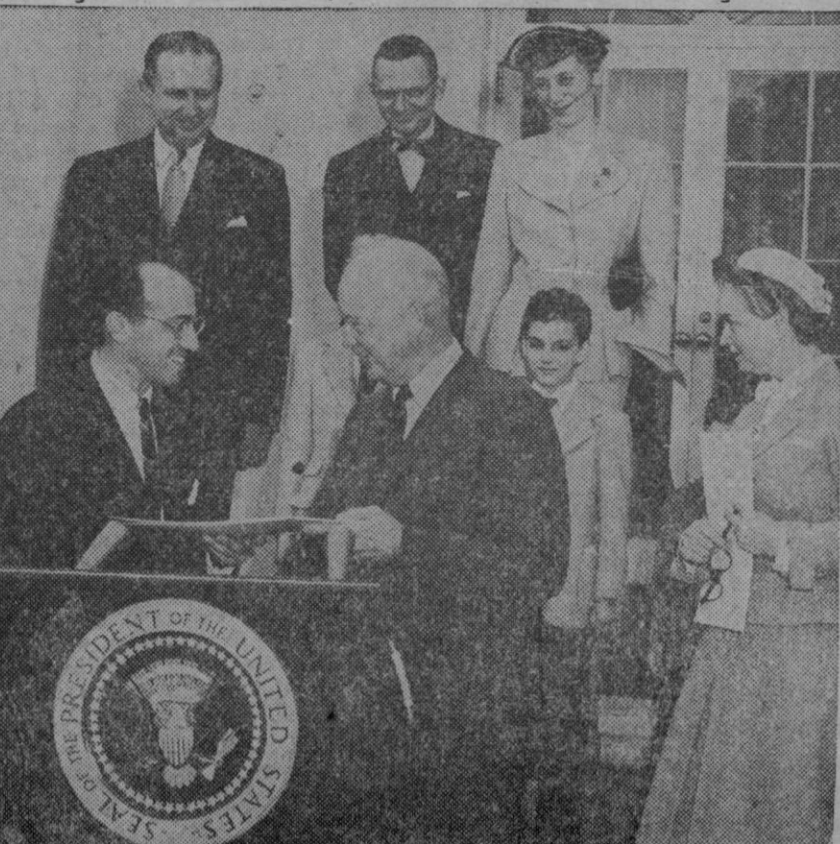
El doctor Jonas E. Salk, de la Universidad de Pittsburgo, hombre de ciencia descubridor de la vacuna contra la poliomielitis, recibe de manos del Presidente Eisenhower una mención especial en un acto celebrado en la Casa Blanca, durante el cual se hizo eco el Presidente de la gratitud de la nación por la «histórica aportación del doctor Salk al bienestar de la humanidad».