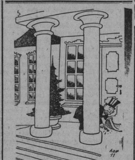
La llave debajo del limpiabarros

En el número octavo de esta orden se declara que la existencia de signos externos de renta gastada o consumida no permitirá, en ningún caso, inquisición sobre la vida privada ni sobre el hogar de las personas en quienes tales signos se hubieren apreciado.