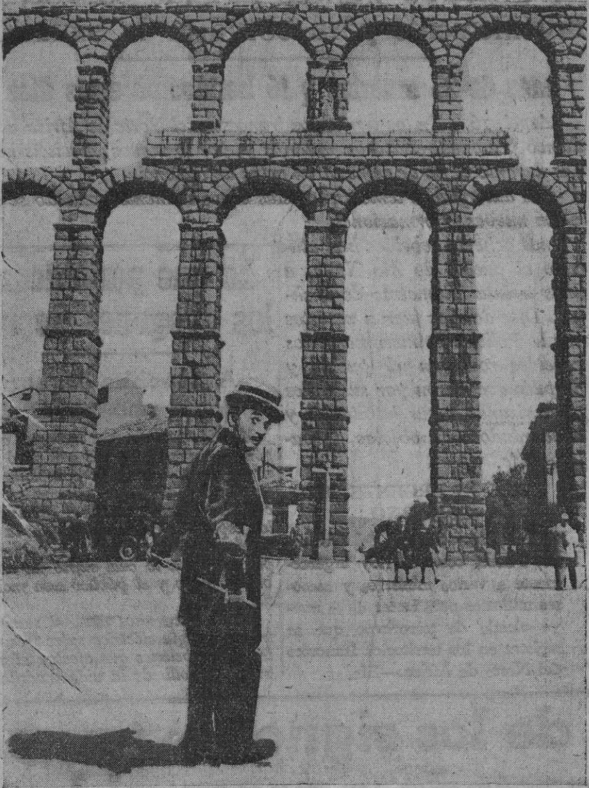
SEGOVIA.—Charles Chaplin llega a nuestra ciudad a través de "Candilejas", su mejor película. Naturalmente, para su presentación ha escogido el marco suntuoso del cine Las Sirenas.