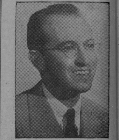
El doctor Jonás E. Salk, descubridor de la vacuna contra la poliomielitis. Tiene cuarenta y un años de edad. Nació en Nueva York y estudió en la Universidad de esa ciudad. Fue profesor de la Universidad de Michigan, en Ann Arbor, antes de serlo de la de Pittsburgh, en la cual ingresó en 1947