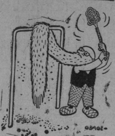
Limpieza a fondo

ADIVINANZA Número 600: El acero nos fabrica, hierba nuestro cuerpo es, andamos de dos en dos y con la punta en los pies.