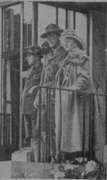
El príncipe Bernardo de Holanda, actual rey consorte, es muy aficionado al «scoutismo», tanto que él mismo fué jefe de los «scouts» de su patria. En la foto aparece, junto a la ya fallecida reina Guillermina, presenciando el desfile de los «scouts» que acudieron a Soedj a rendirle un homenaje en su cumpleaños.

Temperaturas extremas: Máxima de 27 grados, en Murcia, y mínima de tres grados, en Avila y Soria.