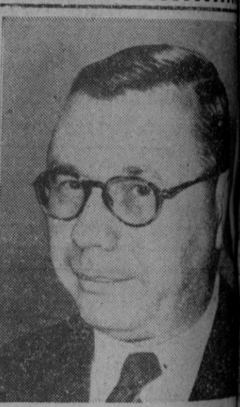
Arkadij Alexandrovich Sobolev, sucesor al antiguo ministro del Interior ruso, Vichinsky, como delegado permanente de la U. R. S. S. en España. O. N. U.

Una vez reunidas estas Comisiones y las de Hacienda y Presupuesto que igualmente se reunirán en este mes, podrá prepararse la plenaria que las Cortes celebrarán el próximo mes de Abril, pasada la Semana Santa.—Cifra.