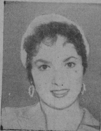
Gina Lollobrigida, la célebre actriz italiana que acaba de ser despedida por su compañía cinematográfica en Italia porque reclama un sueldo demasiado elevado

La Dirección General de Información organizará en el Ateneo de Madrid una fiesta literaria y estimulará la organización de otras en los Ateneos y centros culturales de toda España, y anunciándolas por medio de carteles y publicaciones adecuadas, y, a través del Instituto Nacional del Libro Español, establecerá en dicho día la concesión de un descuento del diez por ciento para las ventas de libros y revistas poéticas.