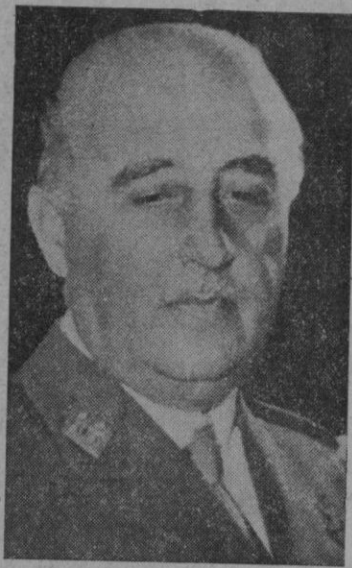
S. E. el Jefe del Estado, Generalísimo Franco

O se le pone freno desde fuera, o acabará anegando a EUROPA y a ASIA