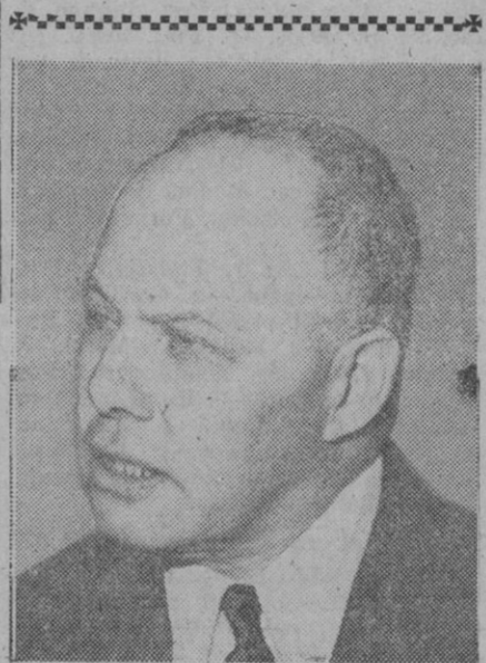
George Meany, presidente de la importante organización profesional americana A. F. I., que acaba de lograr un acuerdo con el jefe de la segunda organización profesional también del país, C. I. O., con vistas a una unión sindical. En 1936, una parte de sus miembros se separaron para formar la C. I. O.