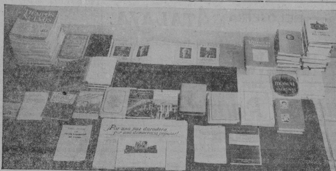
Estos libros comunistas se encontraron entre los efectos personales de Jacobo Arbenz Guzmán después de haber sido derrocado su Gobierno en Guatemala por las fuerzas anticomunistas al mando del coronel Carlos Castillo Armas. Entre ellos figuran obras de Marx, Lenin, Stalin, Mao y Malenkov; ejemplares del órgano de la Cominform «Por una paz duradera y por una democracia popular»; otros libros, folletos y revistas procedentes de Rusia y de sus satélites; los estatutos del partido comunista de Guatemala, y ejemplares de un informe del Comité central del partido comunista guatemalteco.