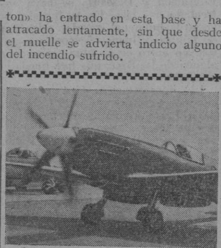
Este es el último «Spitfire» en el momento en que despega de la base del Seletar (Singapur), en su último vuelo contra los terroristas malayos. Estos aparatos que tan útiles resultaron en la última guerra serán sustituidos por el «Mecor», de reacción

Quonset Point, 26.—El «Bennington» ha entrado en esta base y ha atracado lentamente, sin que desde el muelle se advierta indicio alguno del incendio sufrido.