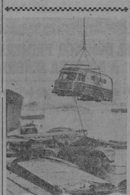
Con la televisión a otra parte. Eso es lo que representa este grabado, aunque a simple vista no lo parezca. Se trata de un vagón móvil de televisión que está siendo cargado en el muelle Victoria del puerto de Londres, con destino al Canadá.

Balboa, 27 (4 t.).—En los medios navales se dice que aún se está investigando sobre las armas a bordo del buque francés «Wyoming», embarcadas en Amberes. Según la Embajada francesa, ni la tripulación, ni los pasajeros están siendo molestados por la búsqueda. Un portavoz de la Compañía ha manifestado que hay a bordo más de 10.000 fardos que sería imposible examinar uno por uno, para estar seguros de que contiene lo declarado.—Efe.