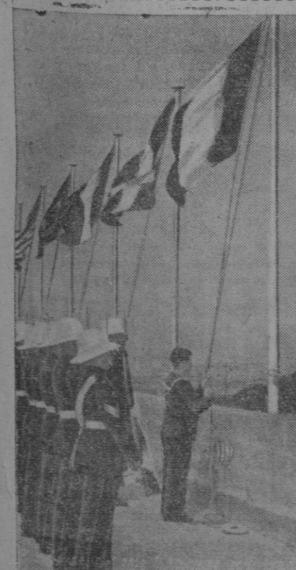
Banderas de seis naciones son izadas en el cuartel general de las fuerzas aliadas en la Valletta (Malta), en el acto conmemorativo del primer aniversario de la jefatura del almirante Mountbatten

«La situación en el delta es seria, pero no desesperada.» UBALDO DE LEON