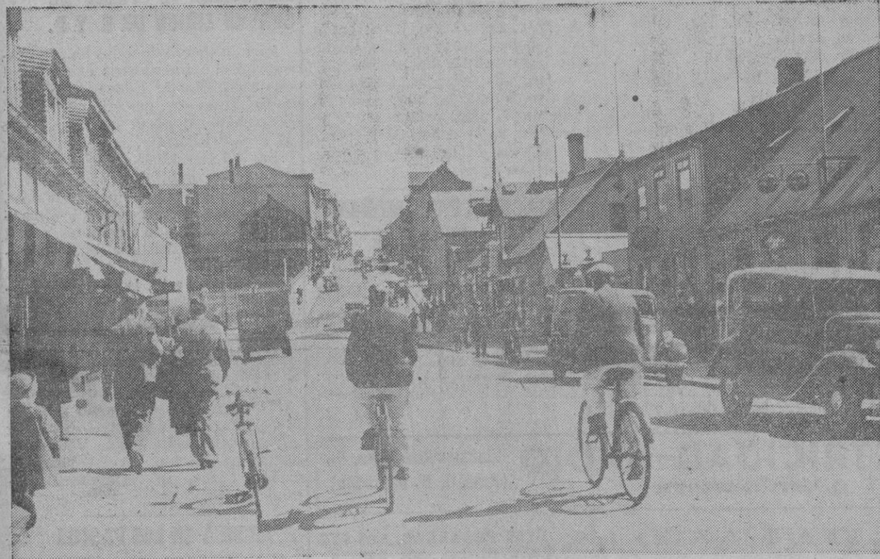
Lo remoto. Esa es la idea que sugiere esta fotografía que nos muestra una perspectiva de la calle principal de Reykjavik, capital de Islandia. Perdida en el mar, en el camino del Arctico está situada la isla, que desea liberarse de toda unión con Dinamarca. Esa pareja de ciclistas, esos peatones despreocupados, esa ancha calle, como pueblerina, llena de sol, todo tan cerca de la vista y tan lejos físicamente y tan distante en todos los órdenes, nos sugiere intensamente la idea de lo remoto. La ciudad está situada en la costa suroeste de la isla, en un ángulo de la bahía de Faxa. Sus casas, exceptuando la catedral y algunos edificios públicos, son de madera. Tienen su residencia, en Reykjavik, la Sede episcopal, el Tribunal Supremo y los poderes del Estado. También hay una Universidad, con Facultades de Teología, Derecho, Medicina y Filosofía, y varias escuelas de carácter especial.

Roma, 3 (4 t.).—Yma Sumac, llamada «El ruiseñor de los Andes», ha debutado en la capital, ante una concurrencia que llenaba por completo el teatro «Quattino Fontane». El éxito de la cantante peruana ha sido clamoroso.—Efe.