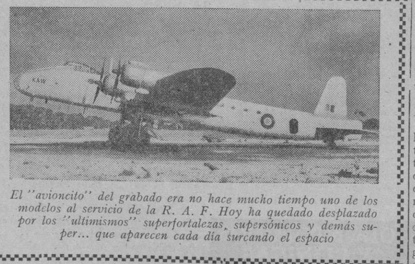
El «avioncito» del grabado era no hace mucho tiempo uno de los modelos al servicio de la R. A. F. Hoy ha quedado desplazado por los «ultimismos» superfortales, supersónicos y demás super... que aparecen cada día surcando el espacio