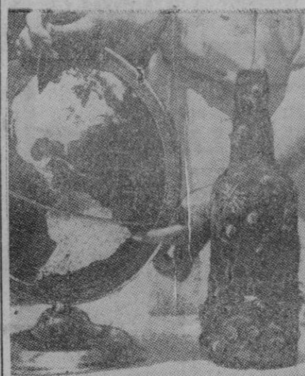
El mar debe guardar en sus abismos infinidad de objetos curiosísimos perdidos por aquellas profundidades. Uno de ellos esta botella con esos adornos de la vida submarina, ha sido encontrado en su fondo. Sobre el globo alguien parece señalar probablemente el lugar donde fue encontrada.

El tendido de este cable, llamado coaxial que unirá a Madrid y Barcelona, por Zaragoza, va muy adelantado, habiendo sido tendido ya, partiendo de Madrid, mas de cien kilómetros, y se trabaja en el montaje en Zaragoza, de la correspondiente central automática.—Cifra.