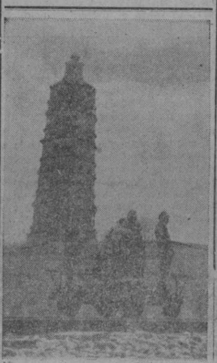
La guerra, a su paso, deja un enorme conjunto de recuerdos amargos, pero también muchos de ellos curiosos, como el presente grabado, que "encuadra" una patrulla de soldados japoneses haciendo vigilancia, sobre una vagoneta, en la vía del ferrocarril Shanghai-Nankin.

Roma, 31 (4 t.).—Corrimientos de tierras amenazan hoy, sábado, ampliar áreas de la península italiana, después de las inundaciones y tormentas. Las laderas de las montañas amenazan con deslizarse para sepultar aldeas enteras, del norte y sur de Italia. Muchos kilómetros de carretera están interceptados por piedras, lodo y escombros. La aldea calabresa de Parpagliati, cerca de Catanzaro, ha sido evacuada ante el temor de que se desplome sobre ella la montaña cercana. La primera nevada de la temporada ha caído en Cortina.—Efe.