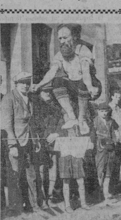
Cosas extrañas nos toca ver en este mundo, pero ¿imaginarían ustedes el verdadero contenido y significación de esta fotografía? Bueno, pues se trata de un vendedor de periódicos que realiza propaganda electoral. Como no tenía medios para llevar ésta a cabo, y quería a pesar de todo sentarse en el Consejo municipal, recurrió a "sus propios medios" (entonces le captó el fotógrafo). Ocurrió en unas elecciones municipales en Auvers.

Berlin, 5.—La Oficina de Información del Berlín occidental dice que millares de obreros de la Alemania roja están desafiando de nuevo la ley marcial y los tanques del Ejército soviético, en otra oleada de huelgas, de las que la más destacada es la de los operarios de la fábrica de óptica Zeiss, en Jena (Turingia), que piden la libertad de novecientos compañeros detenidos por participación en la rebelión del 17 de Junio.