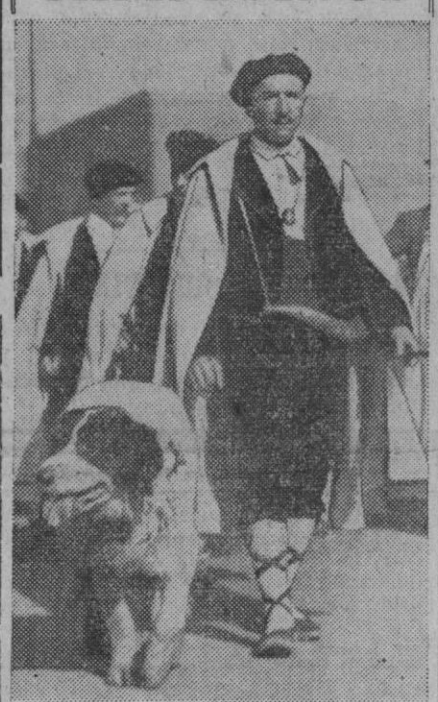
Estos campesinos franceses, ataviados con sus trajes típicos, desfilan por París con motivo de la celebración del día de las provincias, en la Exposición de la ciudad Luz. En cuanto al perro, no sabemos exactamente qué pensar; desde luego nos parece sumamente "respetable", ¿no lo creen así?