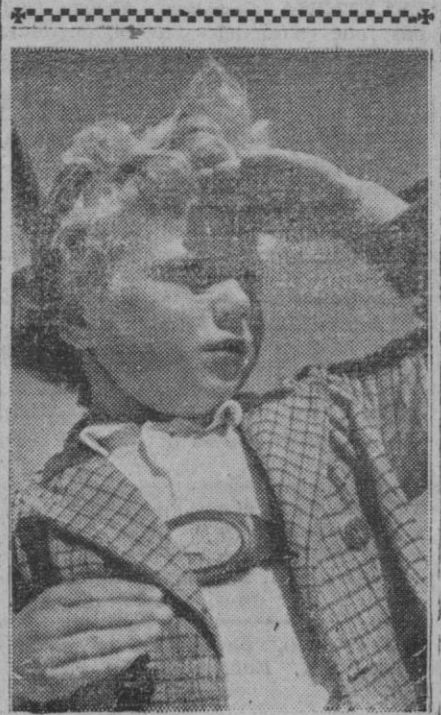
El sol de los maravillosos montes del Tirolo es brillante e intenso, lo que contribuye a aumentar la belleza del paisaje. Aquí, esta niña tirolesa se protege los ojos con la mano para mirar con buena visibilidad la lejanía, emborronada por la bruma del fuerte calor del astro.

En la tarde de ayer, el teniente general García Valiño emprendió otra vez a caballo el recorrido hacia Ain Grana. A los lados de la pista que recorría, millares de cabileños, montados y a pie, esperaban al alto comisario y se unieron después a su comitiva hasta Tazarut, donde se halla enclavado el magnífico palacio de la familia Raisuni. Todas las laderas del monte estaban llenas de cabile-