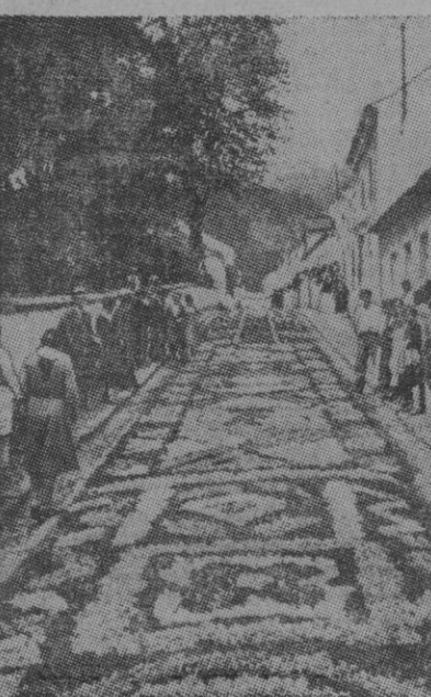
Este espectáculo de maravilla, que resulta de la labor paciente del artista de las flores, pueden ustedes admirarlo si se dan una vuelta por cualquiera de las islas Azores, en día de gran solemnidad. Allí está tomada esta fotografía y aunque tengan que sufrir algo con la imaginación, pueden darse una idea de la belleza, tan efímera tristemente, de la vegetal alfombra.