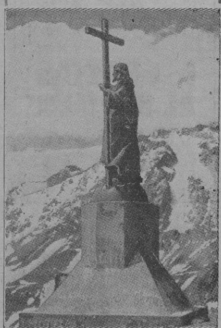
A 3.700 metros de altura, en los Andes chilenos, existe esta imagen de Cristo, modelada con el bronce de un cañón. En el pedestal, para expresar su significado, dice una inscripción: "Estas montañas se transformarán en ruinas antes que los pueblos de Chile y Argentina rompan el juramento que los dos países han jurado mantener al pie de Cristo, nuestro Salvador".