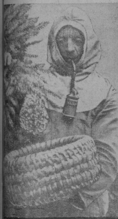
Este personaje no es un jeque moro, ni tampoco un monje, pues se trata de un apicultor que coge un enjambre en el mes de Mayo, cuando más puede producir.