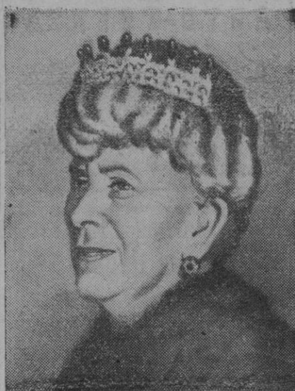
La fallecida Reina Mary de Inglaterra

La habitual buena salud de la reina Mary la abandonó varias veces en los últimos años. En el invierno de 1930 sufrió un fuerte ataque de ciática y más tarde diversos resfriados. Los doctores le suplicaron que cesara en su rígida forma de vivir y le aconsejaron que no durmiera con todas las ventanas abiertas. La reina madre se burlaba de muchos elementos de la vida moderna y manifestaba su orgullo al revelar que nunca usó el teléfono; «No es un instrumento para reinas», solía decir. Se cuenta que durante el pasado conflicto se negó a abandonar Londres; a pesar de los constantes bombardeos de que era objeto la capital. Una vez tuvo que ser retirada una bomba de aviación caída en su jardín y que no había hecho explosión. La reina Mary no sólo