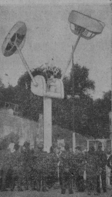
He aquí una de las novedades que más ha llamado la atención de los parisinos en su centro de recreo al aire libre. Se trata de un aparato que gira continuamente durante el día con sus pasajeros.