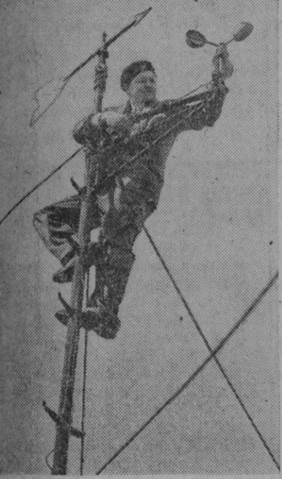
El meteorólogo de una expedición norteamericana a las regiones árticas inspecciona el aparato medidor de la velocidad del viento, colocado en uno de los mástiles de la embarcación.