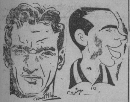
Bosch y Panizo

Después del partido, el optimismo no puede contenerse. Las más destacadas figuras del