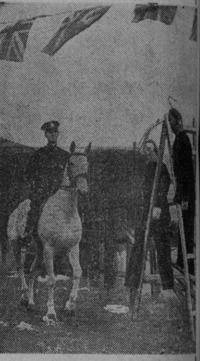
Scotland Yard ha tenido que prestar unos cien caballos para el escuadrón de seguridad que actuará durante las fiestas de la coronación en Londres. Los agentes entrenan a los caballos ante grandes muñecos que en este caso representan al público.