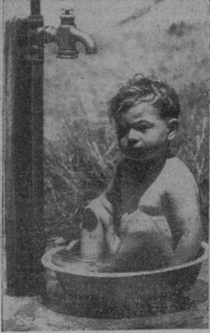
El pequeño no tiene baño, pero él no renuncia tan fácilmente a su chapuzón diario, en el que encuentra sus delicias como todos los peques, y se las arregla del modo que muestra el grabado para no perder la costumbre.