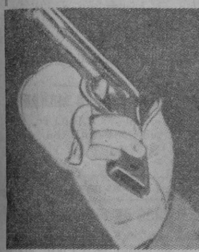
Guante utilizado en el Ejército norteamericano para climas de temperaturas bajas.