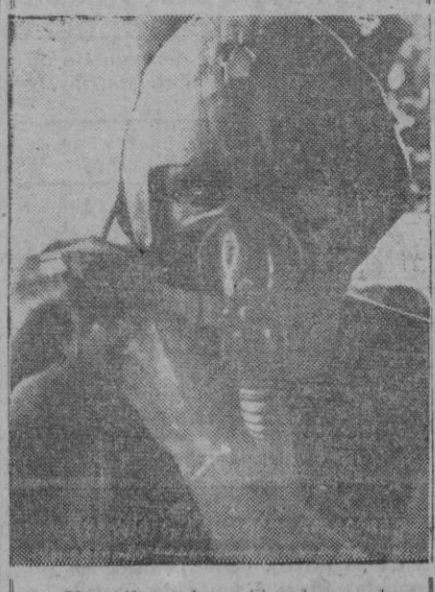
Un piloto de avión de combate colocándose la máscara de oxígeno que tendrá que utilizar cuando el avión alcance grandes alturas donde el aire se hace irrespirable.