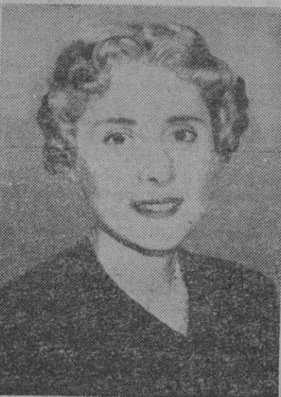
Esta señora se llama Clare Boothe Luce, que ha sido nombrada embajadora de los Estados Unidos en Roma. Forma parte además del Congreso y es la primera mujer que ocupa un cargo de tan desmedida confianza.