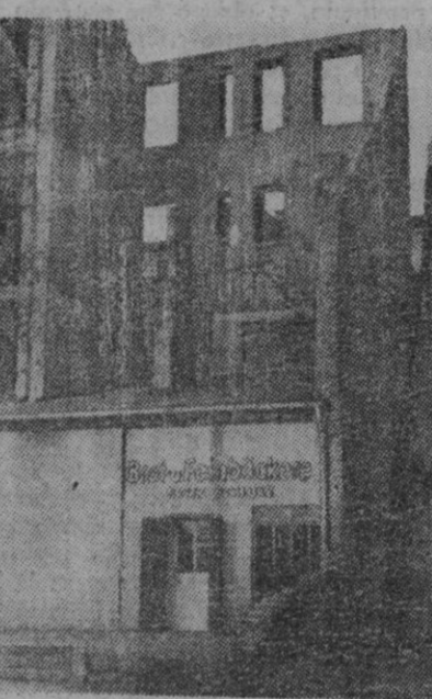
Con un fondo de ruinas, en un lugar de Berlín, se manifiesta el deseo de supervivencia en esta pequeña panadería que aparece en primer término, después de una restauración provisional que no servirá para cuando llegue la reconstrucción total de la finca.