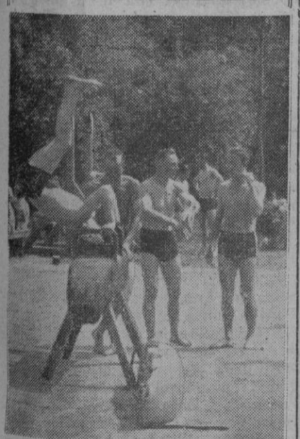
Hay que fortalecerse. Esto es lo que hacen los jóvenes de la foto en un gimnasio, aprendiendo a saltar en el "potro".