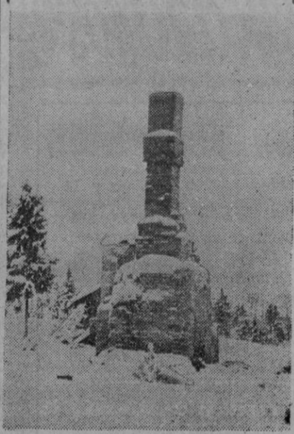
En pleno Cáucaso se levanta este monumento de granito, que consiste simplemente en una cruz.