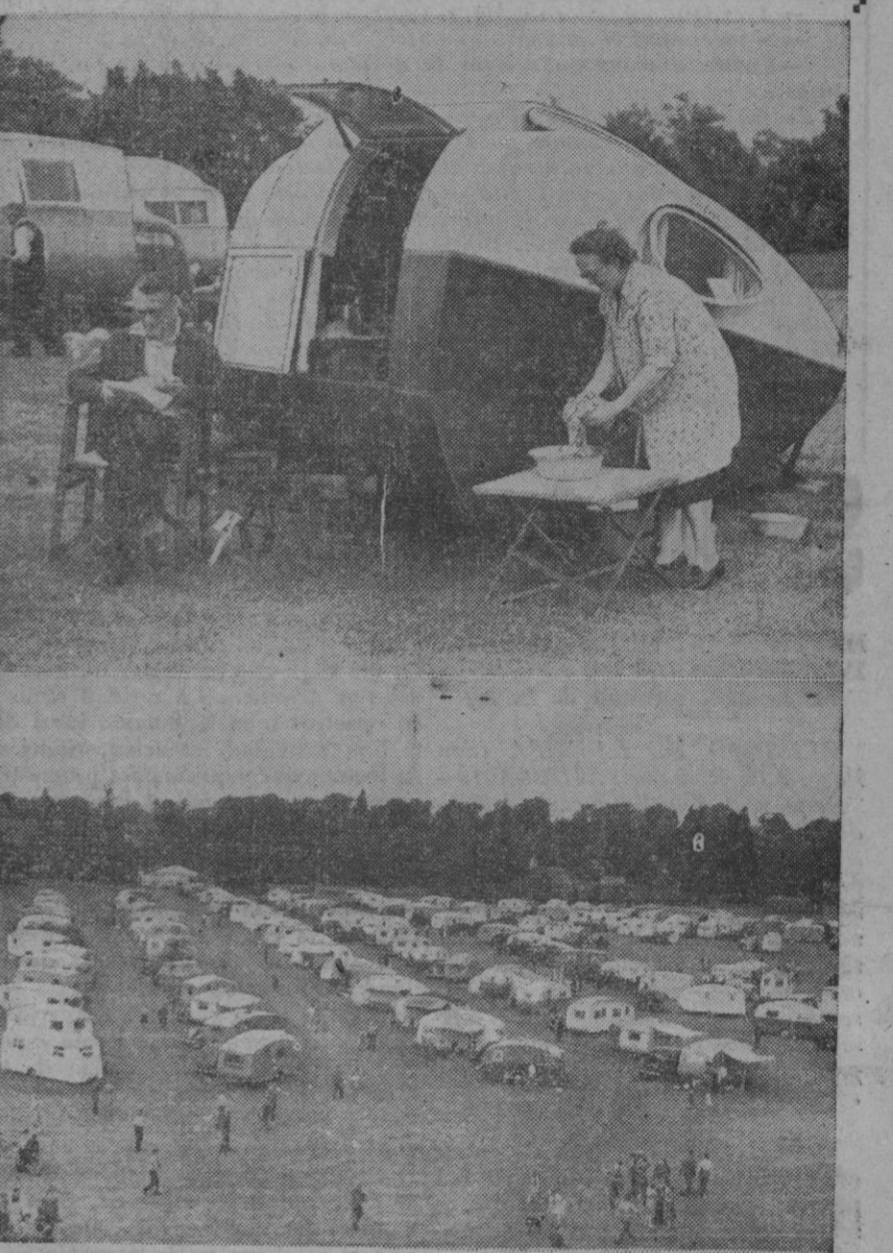
Esto es lo que se llama llevar la casa a cuestas, como los caracoles. Son automóviles fabricados en serie, que son fácilmente adaptables para vivienda. Con esto los fines de semana se facilitan a los americanos que huyen de la ciudad al campo. Pero hoy también en serie y forman grandes campamentos, con lo cual no consiguen plenamente su fin, porque es como si se trasladaran de una ciudad a otra.