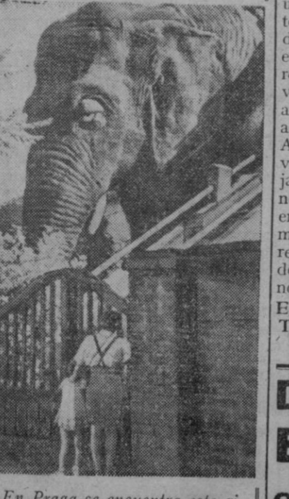
En Praga se encuentra este gigantesco elefante, de tales dimensiones, que sólo verlo produce terror. Lo que ocurre es que el elefante no es de verdad, sino de cemento y en su interior alberga un curioso restaurante.