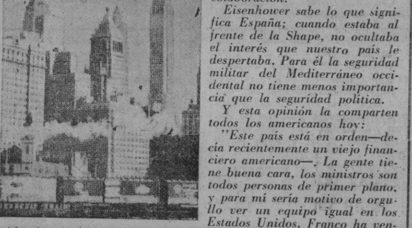
Washington. (Servicio especial para EL ADELANTADO).—¿Cómo ve el general Eisenhower las futuras relaciones entre España y los Estados Unidos?