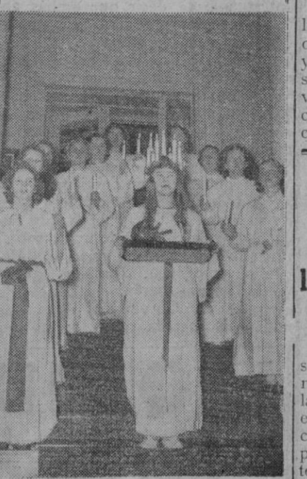
Las señoritas de la foto celebran una de las fiestas más tradicionales, en la que no faltarán las canciones, ni mucho menos. La señorita del centro, con las velas en la cabeza, es la protagonista y ofrece a las otras café y pan fresco.