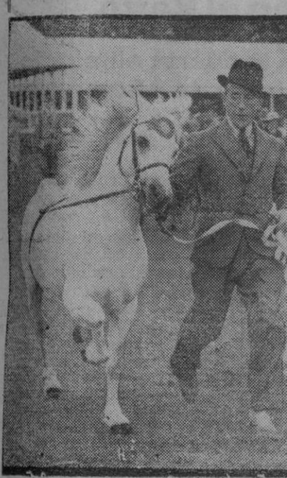
Una fascinadora jaca que ha ganado el primer premio en una exposición. Un muchacho que la vio, decía a su padre que es más bonita que las del "tióvivo".