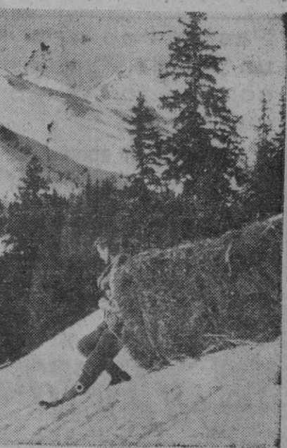
Este campesino está dando una prueba de la firmeza que poseen sus piernas, al mantener sin que se precipite ese gran paquete de heno que baja sobre un trínco especial.