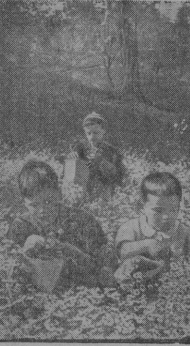
Estos niños buscan plantas medicinales. En muchos países el «stok» de plantas medicinales está reduciendo al mínimo y se vuelve a la vieja costumbre de recoger y emplear estas plantas medicinales en infusión.