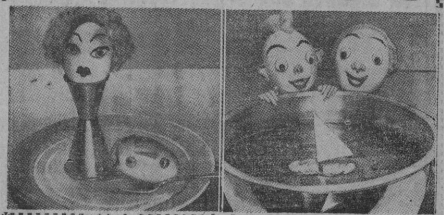
Esto que ven ustedes tiene su significación real. En el dibujo de la izquierda una coqueta ve cómo yace el novio a sus pies y, a la derecha, los niños ven el bañador en el agua.