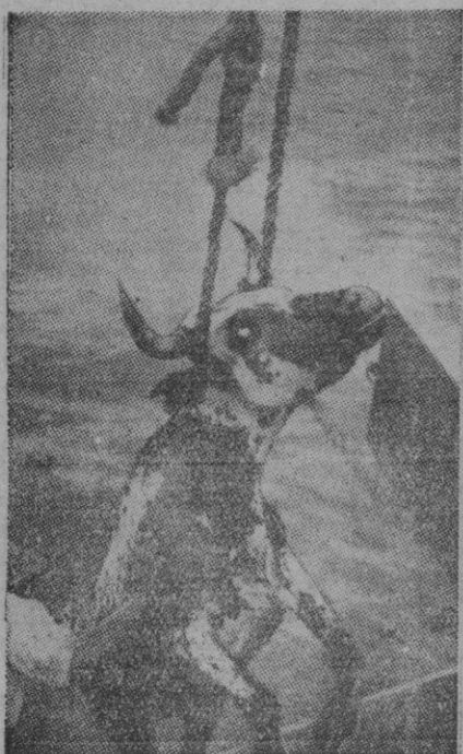
No se trata de un suicidio. Este animalito, con otros muchos, está destinado a un barco para la exportación y esta es la original manera de embarcarlo. La escena está tomada en un puerto de Nicaragua.