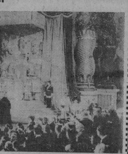
(Continúa en la página 3)