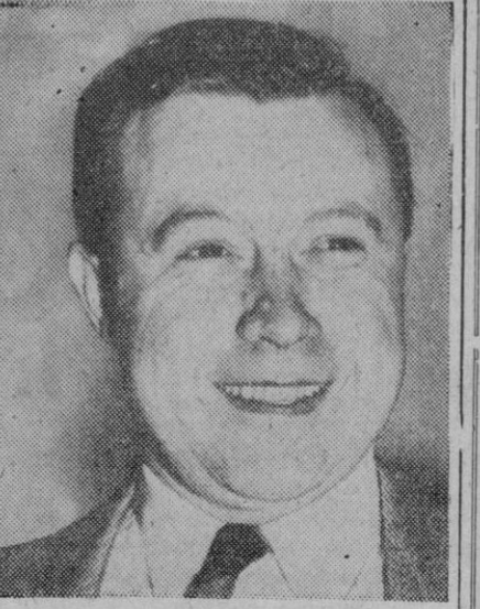
M. Walter Reuter, nuevo presidente de la poderosa organización sindical C. I. O., de Estados Unidos