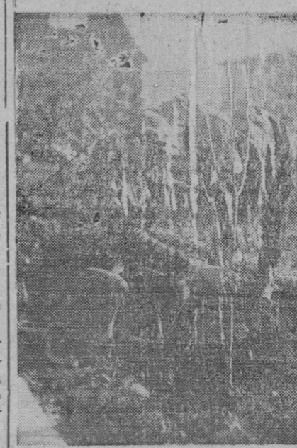
Es la fruta uno de los alimentos más preferidos por el hombre y por esto se procura seleccionar las plantas para después transplantarlas a lugares adecuados, cuya labor realizan los horticultores captados por la cámara fotográfica.