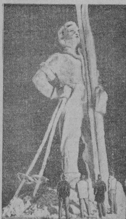
La gigantesca estatua que representa el grabado, ha sido modelada en nieve por un escultor americano para un festival de invierno, y representa a un famoso esquiador noruego.

Con este nuevo golpe de efecto, Rusia sigue la pauta de sus acciones en la Asamblea de la O. N. U.