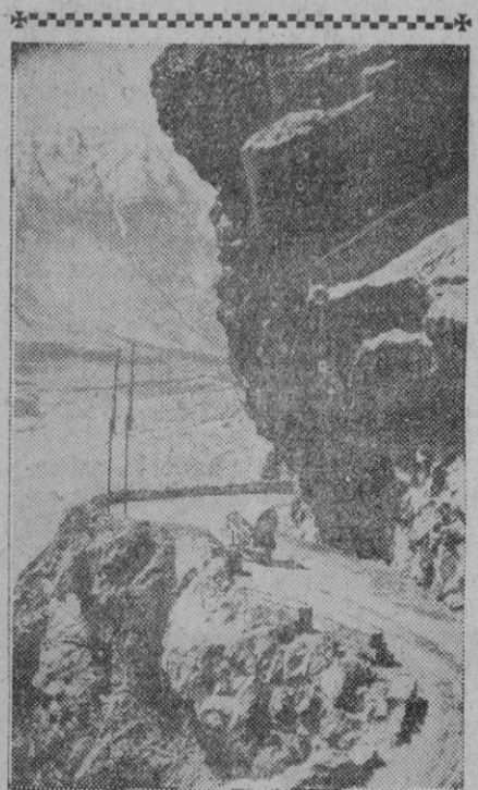
Esta es una de las famosas rutas del Cáucaso, en algunos sitios peligrosísimas. La fotografía la muestra en el momento en que comienza la ascensión. Este tortuoso camino comienza en Tiflis y termina en Vladiscaucaso.

Por último, se llevó a efecto la constitución del Consejo Nacional de Prensa, que está formado por los Comités de delegados del ministerio de Información y directores de periódicos nombrados en las cinco reuniones celebradas, y que actuará durante todo el año de 1953 como órgano asesor y consultivo superior de la Prensa. Con estos acuerdos ha quedado clausurado el I Consejo Regional de Prensa.