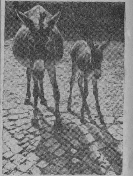
Madre e hijo se han retratado. El pequeño, más tímido, se ha retratado un poco, pero permanece sereno ante la cámara, con la clásica seriedad asnal, a pesar de que es posible que el fotógrafo les pidiera "una sonrisita, por favor"...