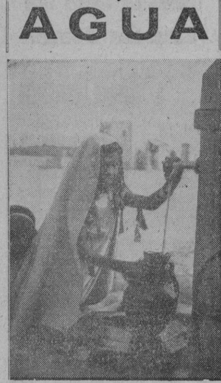
AGUA El agua es el elemento más importante para los habitantes de Libia. No es frecuente, ni mucho menos, y esto hace que sea buscada y que se haga preciso traerla de los sitios donde abunda a algunos poblados. En la fotografía una mujer llena su cántaro en uno de los depósitos que han sido traídos al centro de un poblado desde un río lejano.

Beirut (Libano), 18.—El corresponsal de la United Press en la capital libanesa, George Biter, recoge en una crónica la impresión de que el viaje realizado en la primavera pasada a los países del Oriente Medio por el ministro español de Asuntos Exteriores, ha consolidado sensiblemente la buena disposición mutua entre los países que cierran las puertas oriental y occidental del Mediterráneo.