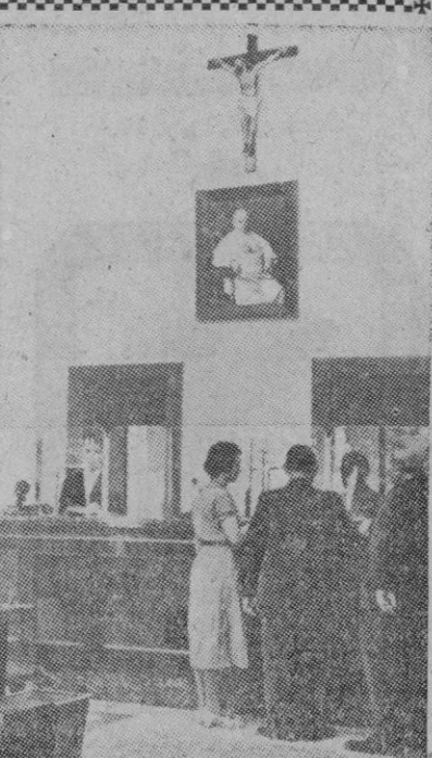
Esta foto muestra un aspecto de lo que es la oficina de correos del Vaticano. Como se aprecia claramente no puede darse más sencillez, sin que en ningún detalle pueda fijarse un intento de esplendor.

Washington, 4 (4 t.).—El Gobierno soviético ha informado al departamento de Estado que ha devuelto a la Embajada norteamericana en Moscú 35.000 ejemplares de la revista «América», que el Gobierno estadounidense publica en lengua rusa y que, hasta ahora, venía siendo distribuida bajo los auspicios del ministro de Asuntos Exteriores soviético.