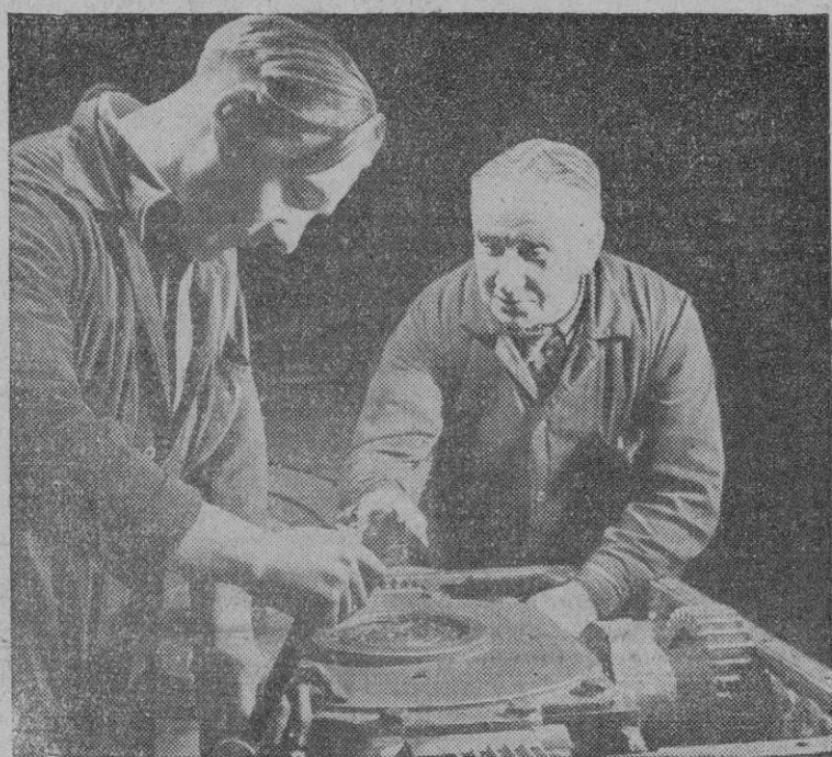
El padre enseña al hijo el manejo de la maquinaria para que adquiera la destreza que le han dado a él los años. Entre los dos hay una corriente de simpatía que nace en el deseo de enseñar por una parte y en el de aprender por otra.

Las personas naturales o jurídicas que deseen acogerse a los beneficios de este decreto, elevarán instancia al Ministerio en la que concretarán la clase y cuantía de los beneficios o garantía que solicitan, a la que acompañarán cuantos documentos de orden técnico o económico juzguen pertinentes para fundamentar su petición y, de modo indispensable por duplicado, anteproyecto sucintamente detallado con presupuesto, programa de tiempo para su realización y estudio anejo de ubicación, materias primas que utilizan, incluso energía eléctrica, productos que se propone obtener, garantía de producción y precios resultantes, así como en lo referente a la financiación, participación de capital extranjero, divisas que le serán necesarias, forma prevista para el pago de maquinaria y utillaje, que tengan que importar, que se puntualizarán en un