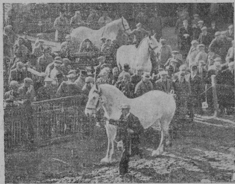
En una feria inglesa se exhibe un magnífico caballo percherón que ha llamado la atención de los concurrentes y que será el que a la hora de los ofrecimientos adquiera mayor ventaja.

Madrid, 17.—El ministerio de Agricultura ha sido facultado para dictar las normas por las que haya de regirse la práctica del desuello del ganado porcino, con el fin de que las pieles de éste puedan ser objeto de aprovechamiento para la industria del curtido. En virtud de este decreto, el ministerio podrá ordenar que de los cerdos sacrificados en los mataderos industriales y en los municipales con destino a fábricas chacineras, sean desollados para el ulterior curtido de sus pieles, en número que, inicialmente, no exceda del cincuenta por ciento de aquellos. En etapas sucesivas, habida cuenta de las necesidades y capacidad de la industria nacional de curtidos, podrá extenderse esta medida hasta hacerla aplicable a la totalidad de los sacrificios de dicho ganado en unos y otros mataderos.—Cifra.