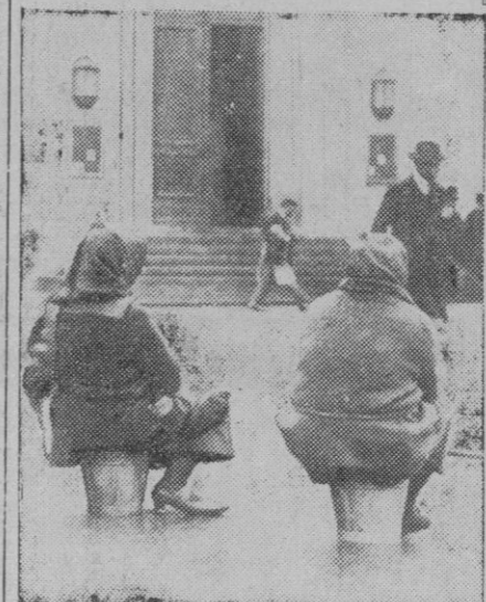
La foto es un poco cómica. Estas señoras sentadas en los cubos, son sirvientas que esperan la llegada de su autobús para ir al trabajo. Los cubos son el instrumento de trabajo que transportan diariamente por las calles de Frankfurt.