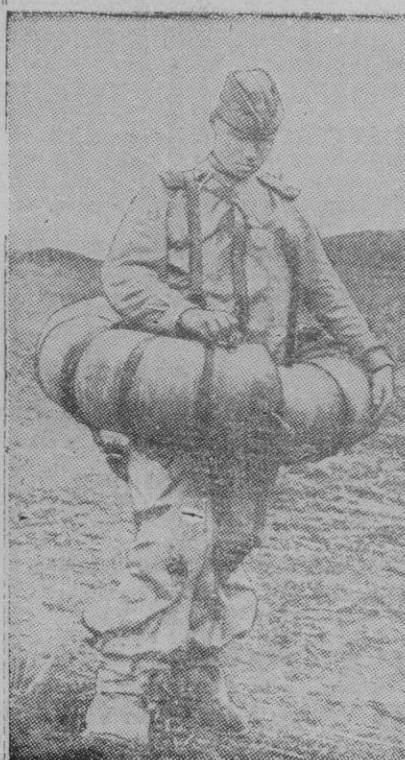
La teoría del neumático, tan sencilla, para atravesar rios los que no saben nadar, se confirma en este complicado traje de caucho que se destinará a los ejércitos con el mismo fin.