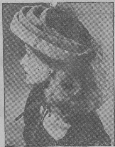
Este sombrero de fieltro es uno de los modelos más recientes que se exhiben en los salones de la moda y que saldrá después a la calle para hacer furor.