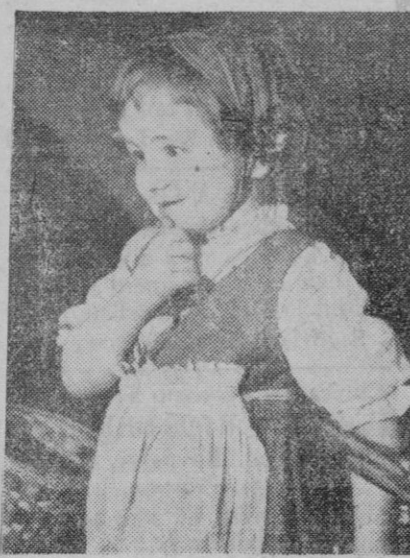
Esta Caperucita es artificial. Desde luego no tiene delante ningún lobo y sonríe para el fotógrafo un poco tímida, eso sí.

Los que desde todos los rincones de la Patria española y desde todas las tradiciones y desde todas las ilusiones y desde todas las fidelidades oímos la voz desgarradora de España y nos alzamos con nuestras viejas o nuevas banderas y corrimos al puesto donde los mejores cayeron y unimos nuestras invocaciones y nuestras canciones en un solo concierto, vamos a vernos el día 19 en el Alto de los Leones. Y luego, vamos a seguir trabajando como hasta ahora, después de comprobar que está en marcha aquello por lo que nuestros camaradas dejaron un hueco en nuestras filas. Viva Franco. Arriba España.