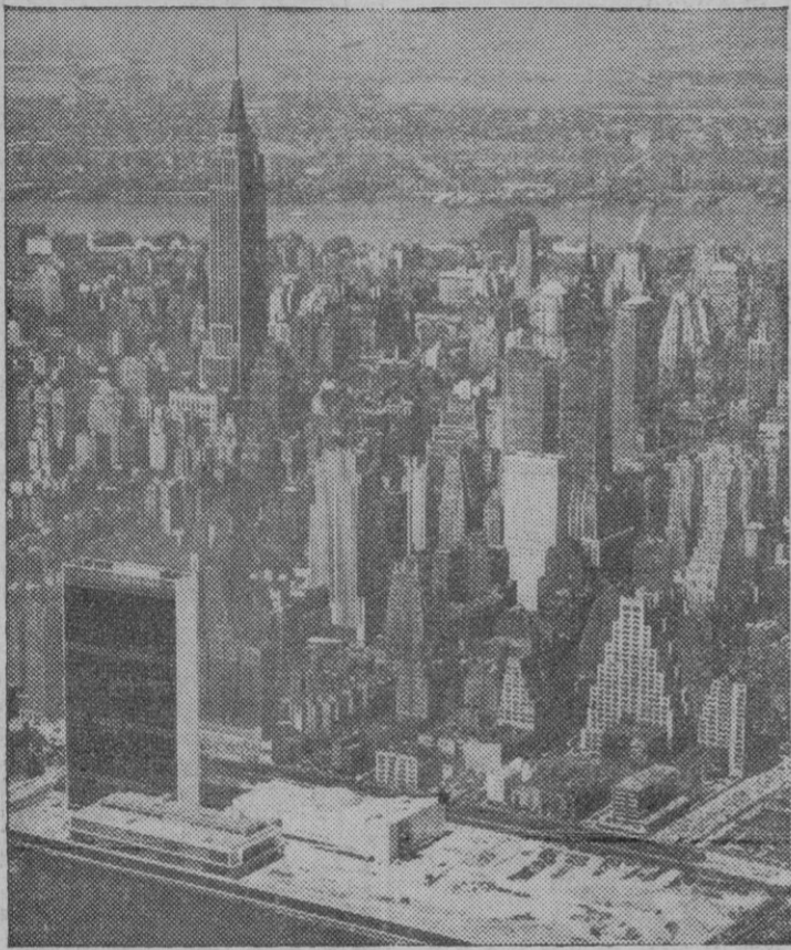
He aquí el escenario donde se verifican las reuniones de la Asamblea general de la O. N. U. En primer término se ven los edificios que constituyen la sede permanente de las Naciones Unidas, ante los rascacielos neoyorquinos. Los tres edificios en cuestión son, de izquierda a derecha, el del secretariado de la O. N. U. (alto y rectangular), el de conferencias y el de la asamblea general. Al fondo se ven el río Hudson y parte de la orilla del Estado de Nueva Jersey.