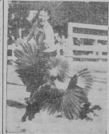
El pavo real es un animal de bastante mal humor. En este caso recoge la foto el mal humor del animal está justificado porque su dueño le invita para divertirse y jugar con él.