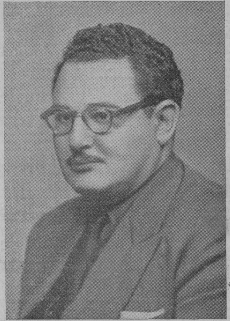
El excelentísimo señor gobernador civil y jefe provincial del Movimiento, ha dirigido el siguiente mensaje a la provincia:

EX-COMBATIENTES SEGOVIANOS: Mañana darán comienzo en nuestra capital las jornadas del I Congreso Nacional de Ex Combatientes, que constituye uno de los acontecimientos más grandes de cuantos han tenido lugar en la España victoriosa de Francisco Franco. Acontecimiento que ya ha rebasado los límites de nuestras fronteras y es comentado en el mundo entero.