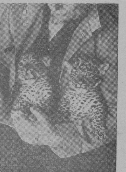
A simple vista, parecen gatitos, sujetado cariñosamente por el brazo del hombre.

Pero dentro de unos años hará falta armarse de un valor especial para acercarse a este par de simpáticos tigrecillos.