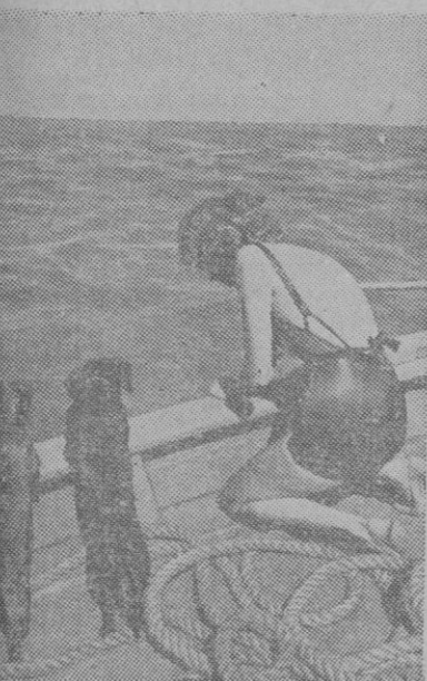
Esta señorita, en alta mar, pesca con un doble esfuerzo. Primero tendrá que procurar que los habitantes submarinos se fijen en el anzuelo. Luego, si se fijan y pican, el esfuerzo será para que los dos perrillos, al acecho, no se lleven la pesca.