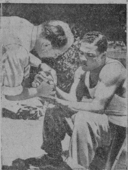
Joe Louis, que aún no ha determinado definitivamente si se retira o no del boxeo, reproduce en esta sus puñetazos para que cuando definitivamente abandone el «duro» oficio, quede el recuerdo de sus «golpes» maestros.