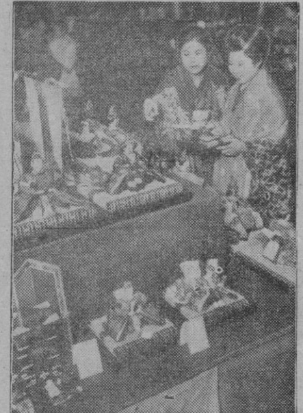
Ante el tinglado de los juguetes, estas dos madres japonesas se deciden a comprar algo para sus peques. En realidad, se lo merecen. Se merecen ese pequeño consuelo, que contrarreste un poco los rigores de la guerra que les persiguen sin que ellos, pobres, hayan hecho lo más mínimo para buscarlos.