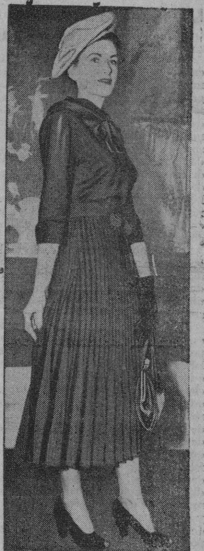
El retorno de la moda es inminente. Este modelo, con aire un poco pasado, será uno de los que hagan furor en este otoño. El modelo se llama «Benedictine», por la cogulla de monge. La falda, plisada, es tulipán.