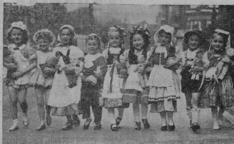
Estas niñas son el contraste de las que aparecen en la fotografía de la página 4. Aquellas, salen del colegio sencillamente, mientras que éstas con sus trajes adornados vienen de participar en un baile infantil. ¡La vida tiene esos contrastes!

EN BILBAO Bilbao, 26.—En la sesión de hoy destacan en Pancos el Hispano, por su mejora de siete duros; el Bilbao gana uno, y el de Vizcaya, dos y medio. En eléctricas, mercado sostenido, salvo en Viego, que cede un duro, y en Española, que retrocede uno y medio. En metalúrgicas, pequeñas diferencias.—Cifra.