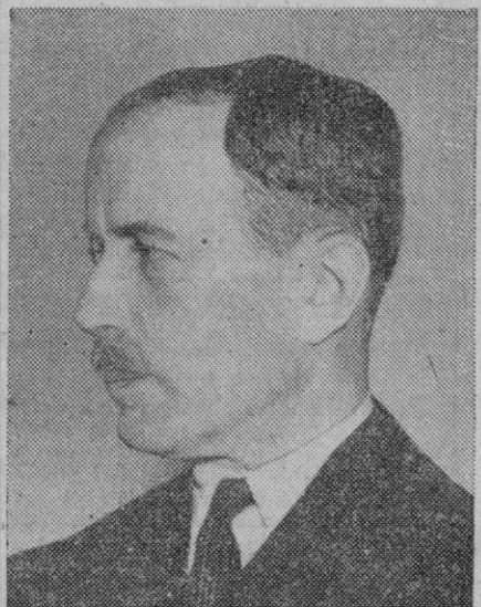
Antoine Pinay, el nuevo jefe del Gobierno francés

París, 9 (urgente).—A primera hora de hoy, miércoles, el jefe del Gobierno francés, Pinay, ha conseguido ver aprobado su presupuesto para el rearme, correspondiente al ejercicio de 1952, tras conseguir salir adelante en diez votaciones de confianza.