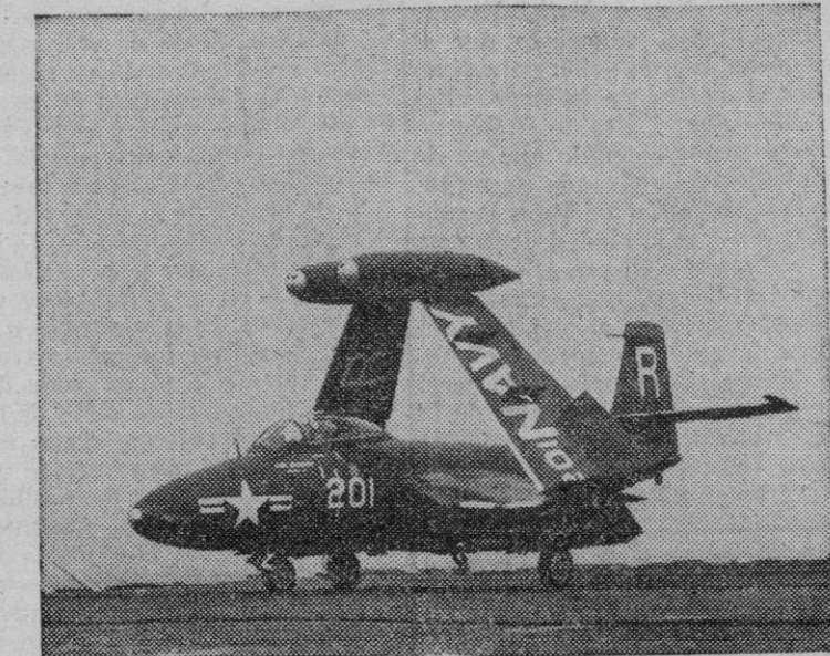
El avión de caza de reacción "P-51 Mustang", de la Marina de guerra norteamericana, que actúa en Corea