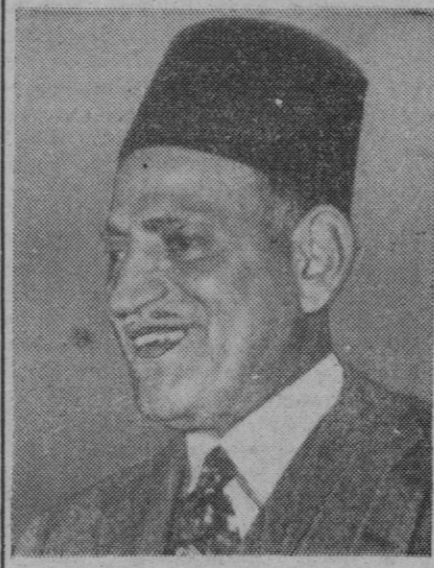
Nahas Pasha, primer ministro egipcio, que denunció el Tratado de alianza con Inglaterra

Carros blindados protegen a los convoyes SE HAN REPRODUCIDO LAS MANIFESTACIONES EN EL CAIRO