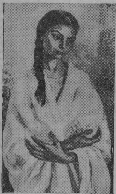
Esta «India» es uno de los ejemplares del moderno arte suramericano que tiene una espléndida representación en la Bienal

El 15 del mes en curso comenzará en la Delegación Provincial de S. F. un curso de especialidades de Cocina, Labores y Trabajos manuales para toda aquella que desee asistir. La matrícula puede hacerse en la Regiduría de Cultura