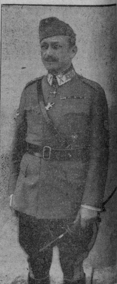
El mariscal Mannerheim

Lausana, 27.—El mariscal Mannerheim, ex Presidente de Finlandia, ha fallecido hoy, a las 22,30 (hora española), en un hospital de Lausana.—Efe.