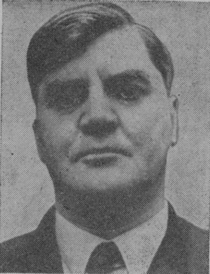
Aneurin Bevan, ministro británico de Sanidad que dirige el grupo de ministros descontentos del Gobierno laborista, y exige la convocatoria de elecciones en Noviembre próximo