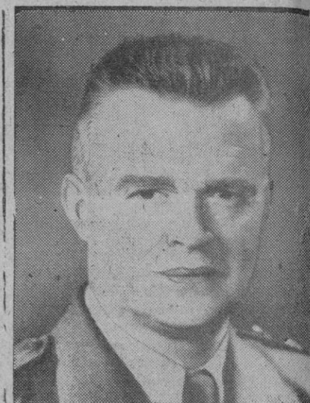
El general de brigada William F. Dean, que ha sido designado jefe de las fuerzas americanas en Corea por el general Mac Arthur. El general Dean fué el primer gobernador militar de Estados Unidos en Corea del Sur

Termina diciendo: «El poderío numérico de los nordistas continúa siendo mayor que el nuestro.»—Efe.