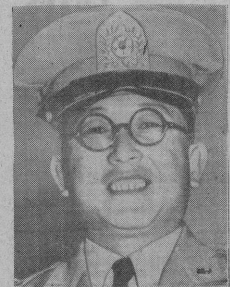
El general Chung Il Kwon, nuevo comandante en jefe de las fuerzas de Corea del Sur

Washington, 13 (1 t.).—Una fuente oficial informativa británica dice que el primer ministro australiano conferenciará con el Gobierno inglés acerca de la posibilidad de ofrecer efectivos del Ejército de Australia para luchar al lado de los norteamericanos en Corea.—Efe.