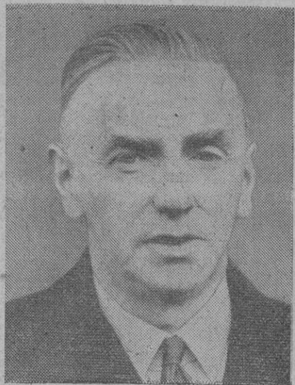
John Costello, jefe del Gobierno irlandés.

«Durante muchos siglos—dijo el Presidente irlandés—España e Irlanda han servido muchas causas comunes y han aspirado a muchos ideales. Es a España a quien Irlanda debe en gran medida la supervivencia de su fe católica. En los momentos de grandes penas, el pueblo irlandés miraba hacia España. A cualquier parte adonde iban los misioneros—agregó—y colonos españoles, llevaban consigo las grandes tradiciones de la civilización católica, adaptaban aquella a las circunstancias de los nuevos países y lugares extraños y cedían sus tradiciones a todos los hombres sin distinción de razas o color. Veían en todos los seres humanos, hijos de Dios.» El Presidente Costello dió la bienvenida a los marinos españoles y a su barco, calificándolos de «símbolos de paz», y como enviados de un pueblo cuya filosofía—como la de Irlanda—se ba-