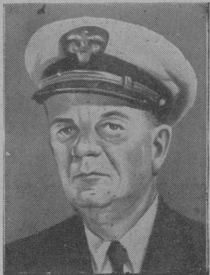
El vicealmirante William Fechteler, nuevo jefe de la flota norteamericana del Atlántico