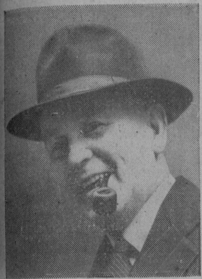
Joseph Chifley, primer ministro del Gobierno laborista australiano

Pero se cree que su mayoría será muy exigua