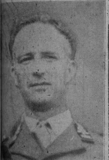
Fotografía de Leopoldo III

Bruselas, 16 (4 t.).—No antes del 22 de Enero se celebrará el plebiscito sobre la vuelta al trono del Leopoldo de Bélgica, ha anunciado el presidente de la Cámara. La ley del plebiscito ha sido aprobada por el Senado y pasará a la Cámara Baja para ser estudiada. Este que dará origen a un amplio debate.—Efe.