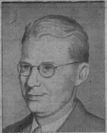
Franz Blücher, vicecanciller de la República alemana del Oeste