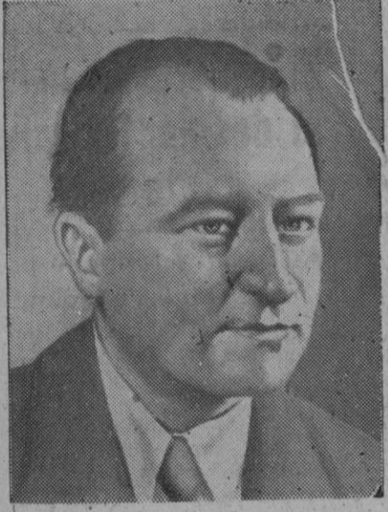
Vlado Clementis, ministro de Asuntos Extranjeros checoslovaco y delegado de su país en las Naciones Unidas, al que la Kominform acusa de "titismo", por lo que tendrá que atenerse, para regresar a Praga, al resultado de la encuesta abierta

Viena, 16 (1 t.).—Mientras continúan los sufrimientos de la Iglesia católica en Checoslovaquia, una delegación de la Iglesia evangélica de Eslovaquia ha visitado al presidente de la Oficina para Asuntos Eclesiásticos, a quien ofreció su más «cal cooperación».—Efe.