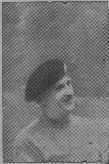
El mariscal Montgomery

Londres, 20 (5 t.).—El comandante en jefe del Consejo Militar de la Unión Occidental Europea, mariscal Montgomery, ha dirigido un mensaje al pueblo británico con motivo del aniversario de la batalla del Alamein. «Nuestra nación—dice—está hoy en peligro. La amenaza no viene de fuerzas armadas. Es una amenaza moral y económica. Las cualidades que nos permitieron terminar victoriosamente la batalla del Alamein, las necesitamos hoy: Espíritu de unidad nacional en un esfuerzo na-