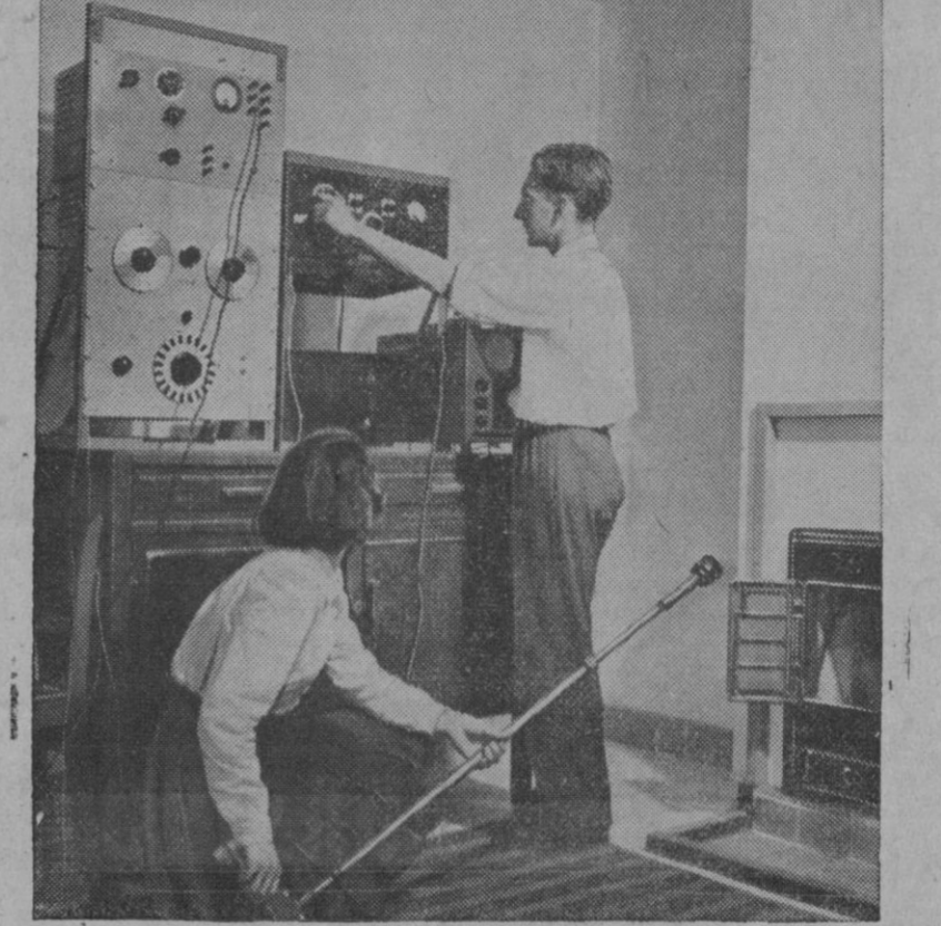
Para encontrar el sistema de calefacción más eficiente y barato, no descansa la investigación científica e industrial. Fruto de tales investigaciones es el mecanismo instalado en el hogar que nos muestra esta fotografía, en el que dos operarios comprueban la cantidad de calorías que pasan por los tubos instalados en las paredes que comunican con las habitaciones situadas en el piso superior.