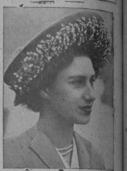
Reciente fotografía de la princesa Margarita

Su visita, de carácter no oficial, durará un mes