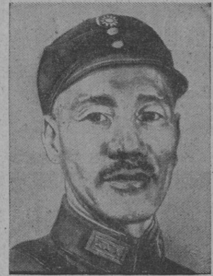
Chang Kai Chek

Predice la «victoria final» nacionalista en el curso de los tres próximos años